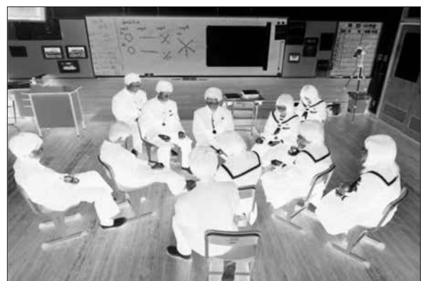
図-2 みかんゲームの授業風景

第5時はプログラミング言語の学習であるが、プログラミング言語とはどのようなものかを理解するために、コンピュータの気持ちになって考えるゲームをする。手順を言葉で表現する伝言ゲームである。図-3に示すような図を、代表となる生徒が言葉で伝え、ほかの生徒は絵を見ないで言葉だけで描く。授業では、できる限り多くの生徒が、言葉で伝える側(命令するプログラマの側)と、その言葉をもとに絵を描く側(コンピュータの側)の両方を体験できるように交代しながら進めるようにし、プログラミング言語とは何かを両方の立場から分かるように体験させている。この体験によって、プログラミング言語とは何か、人に伝えるために大切なことは何