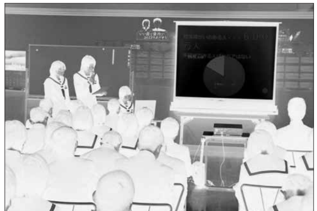
図-1 総合学習の成果発表会の様子

中学校には具体的に指定された情報教育のカリキュラムはない。教科の授業や総合学習の時間で必要な知識や技能を、必要に応じてその場で教えているのが現状である。中学校で必要とされる技能は、調べ学習のためのインターネットを使った検索方法や、学習のまとめを発表するためのプレゼンテーションが中心である。これらは小学校でも扱われているが、小学校によって学習内容やレベルが異なるため、必要な技能は改めて全生徒に教える必要が生じている。これらの学習は、総合学習の学習成果を発表する場で活用されている場合が多い。図-1の写真は、総合学習の時間に調べたことを表計算ソフトでグラフ化し、全校生徒の前で発表する生徒の様子である。